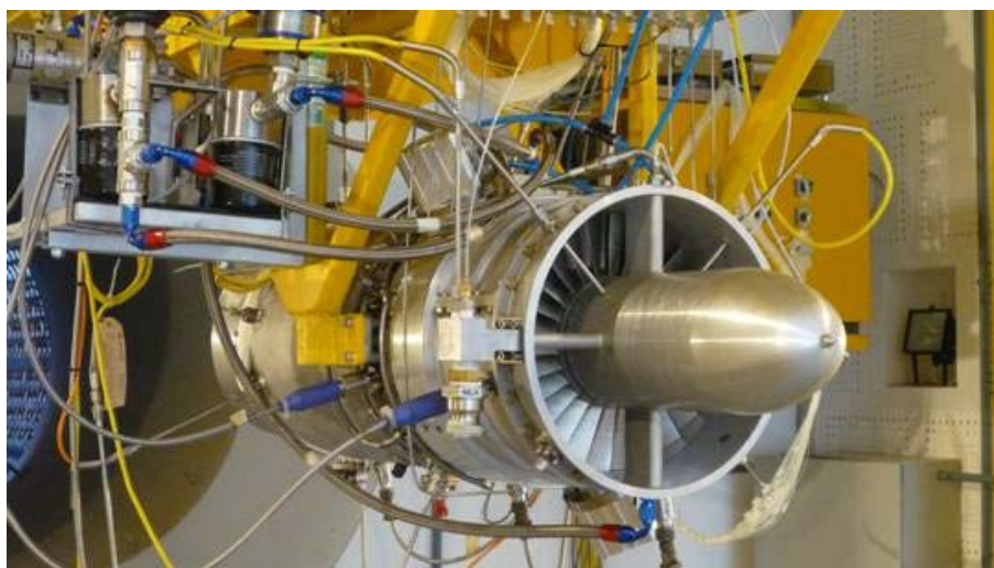
Figura 1 – TR-5000, Turborreator de 5000N, projetado pelo IAE em parceria com a AEROCONCEPTS em testes no Laboratório de Ensaios de Turbinas a Gás.

Análise de Desempenho do Motor: Ensaios detalhados são realizados para avaliar o desempenho teórico e experimental das turbinas a gás , sendo inicialmente obtidos dados provenientes de modelos de ciclo termodinâmico do motor utilizando software comercial como o GasTurb . Os principais parâmetros para a análise operacional do motor são obtidos: empuxo, rotação, vazão de combustível, temperatura e pressão. De posse desses dados, obtêm-se resultados de desempenho do motor, além do consumo específico de combustível e eficiência da turbina. Os ensaios são realizados para conhecer o desempenho da turbina e para detectar possíveis pontos de melhorias de projeto, inclusive corrigindo os parâmetros de desempenho para a condição ISA .