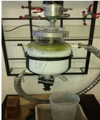
Figura 2: Sistema montado