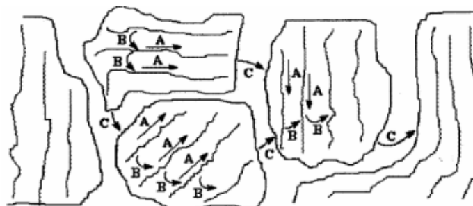
Figura 1: Rede de condutividade em um polímero intrinsecamente condutor.

Com a síntese química da polianilina tem-se a vantagem de produzir um polímero com elevado grau de pureza, já dopado, com alta massa molecular e em grandes quantidades na forma de um pó verde escuro. [14,15] A obtenção de um polímero com alta massa molecular é desejável, uma vez que a condutividade elétrica e a resistência mecânica melhoram significativamente com o aumento da massa molecular do polímero. [16]